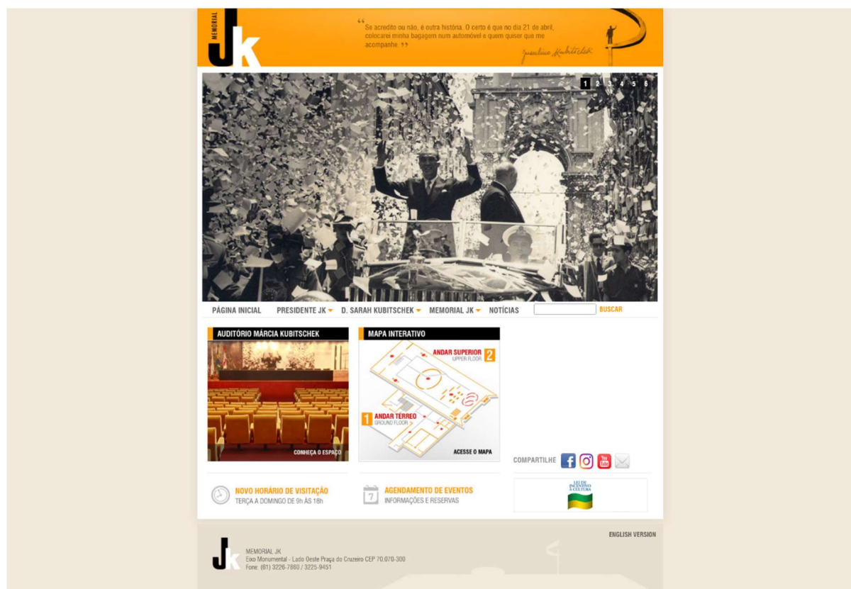
Figura 1 – Página inicial do site atualmente.

O alvo do estudo é o site do Memorial JK, a escolha se deve ao fato do mesmo possuir uma apresentação precária com um design bastante desatualizado, uma falta total de elementos de acessibilidade e a ausência de conformidade com os padrões mais modernos da indústria.