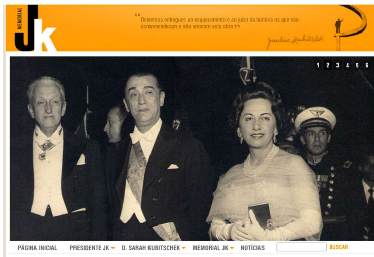
Figura 5 – Topo da página inicial sem elementos de acessibilidade.

O sítio não possui elementos de acessibilidade, o que dificulta usuários com limitações de terem uma experiência sem problemas e em caso mais grave um total impedimento de navegação acesso ao site. A tabela 4 apresenta o formulário de avaliação da heurística.