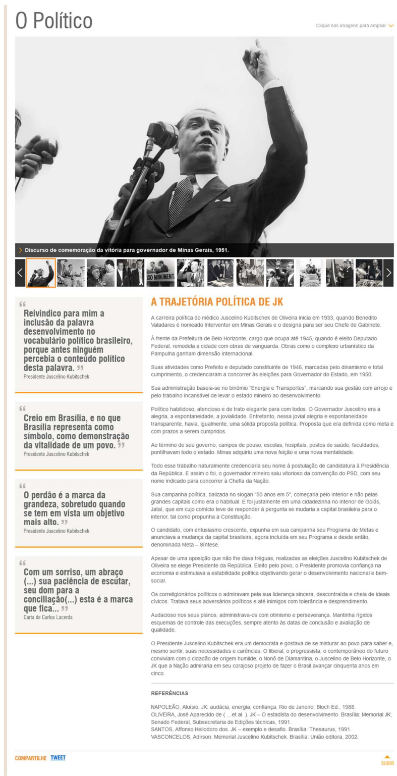
Figura 4 – Página “O Político” com muitos elementos.

A interface possui um design bastante poluído com muitas imagens e informações que competem por atenção. A interface não é responsiva o que dificulta a sua utilização em aparelhos mobile. Há uma confusão generalizada do que deve ser priorizado na página. A figura 4 ilustra uma página com o problema citado.