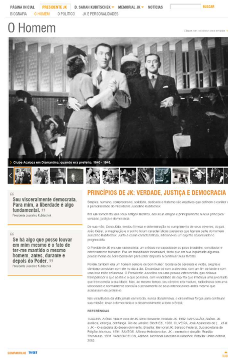
Figura 3b – Página “O Homem” da seção Presidente JK.