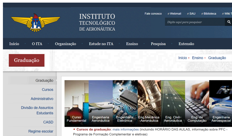
Imagem 2: Site do ITA no menu Ensino. Print tirado dia 28/10/2024 às 13:23.