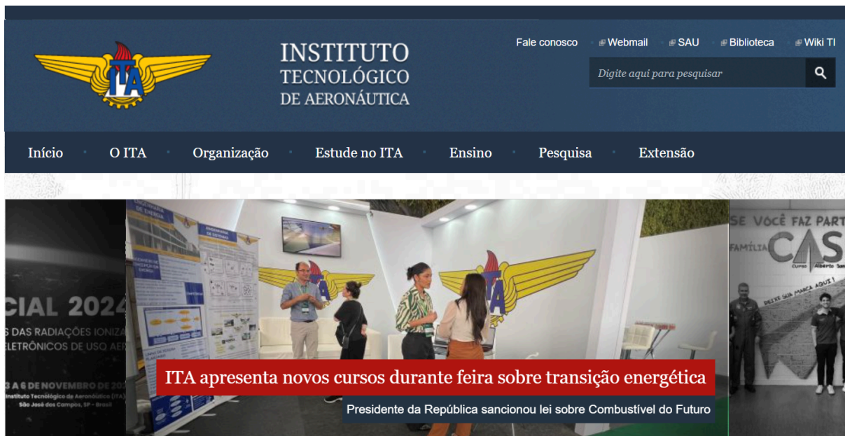
Imagem 1: Site do ITA no menu principal. Print tirado dia 28/10/2024 às 13:14.